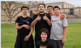
Casas Club Comunitarias