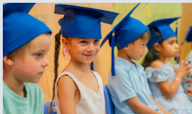
Cuidado de niños con licencia