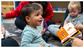
CUIDADO DE NIÑOS CON LICENCIA