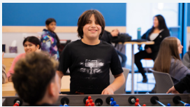
CASAS CLUB COMUNITARIAS